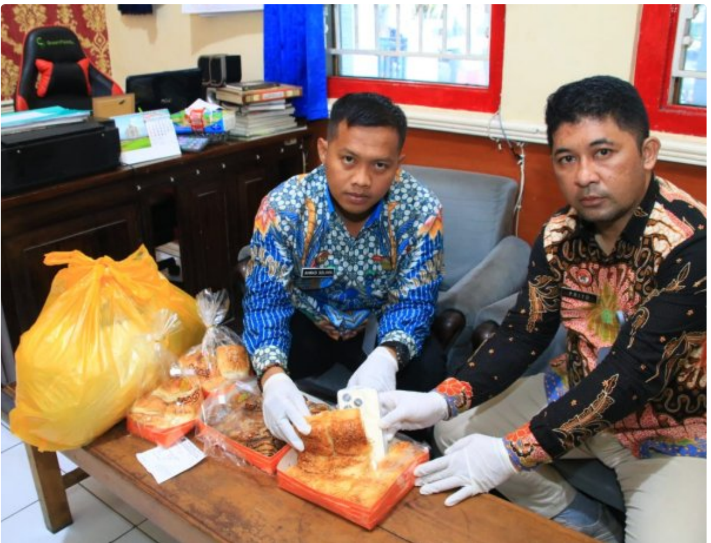
Petugas Lapas Banyuwangi berhasil menggagalkan penyelundupan HP ke dalam lapas

BANYUWANGI - Petugas Lembaga Pemasyarakatan (Lapas) Kelas IIA Banyuwangi berhasil menggagalkan upaya penyelundupan handphone ke salah satu narapidana, Sabtu (18/1/2025). Handphone itu akan diselundupkan oleh B